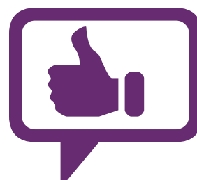
JSPA Facebook lapa

4. attēls. Top 3 atbalsta mehānismi dažādu programmu īstenotājiem