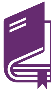
Projektu īstenotāja rokasgrāmata

3. attēls. Top 3 atbalsta mehānismi programmas "Erasmus+: Jaunatne darbībā" īstenotājiem