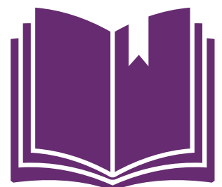
Informatīvais vai metodoloģiskais materiāls