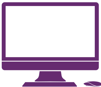
Aģentūras mājaslapas "Erasmus+" sadaļā publicētā informācija